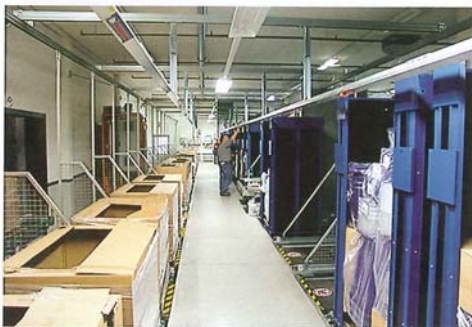
Paletten-Kommissioniersystem Dynamom 1000

Die Transnorm System GmbH aus Harsum, Hersteller von Materialflusssystemen, stellt das energiesparende SmartSort®-Sortierfördersystem RC22 aus. Es kann stündlich bis zu 4 000 Kartons ausschleusen, wobei die recht hohe Geschwindigkeit von bis zu 1,7 m/s beibehalten wird. Die Baukasten-Basis der Sortierlinie bildet ein mit Flachriemen ange-