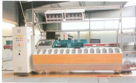
Arbeitsplatz des „pick to bucket“-Kommissioniersystems

Die LogControl GmbH aus Pforzheim unterstützt mittelständische Unternehmen mit Beratung, Services und effizienten Softwarelösungen, die die komplette Lagerlogistik bis hin zur Supply-Chain-Optimierung abdecken. Unternehmen, die schnell in Betrieb gehen wollen, haben die Möglichkeit der Rapid Standard Use-Einführung. Bei dieser sog. „Blitz Einführung“ werden zu-