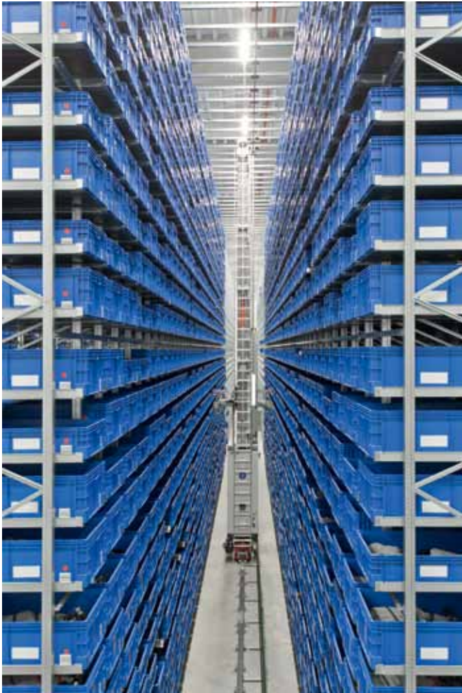
5 Im AKL-Block 1 mit 40.800 Behälterstellplätzen werden die Kabelsätze gesammelt und bis zum Vormontageabruf gepuffert.